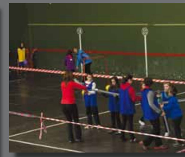
Hilaren 14an, txikieneko jokoak egin zituzten Intxaur Frontoian