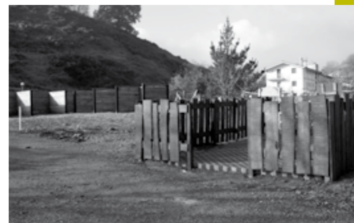
Danena zelai ondoan prestatzen ari diren gunea.

"helburua ez da isuna, birziklapenarekin bat egin dezaten lortzea baizik".