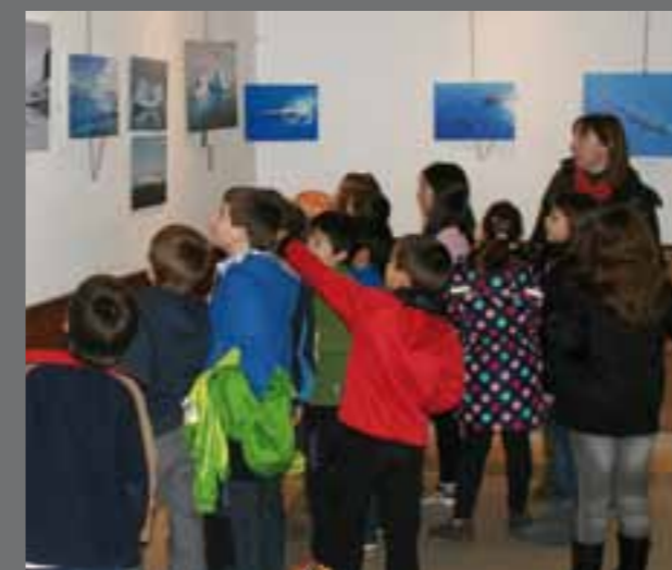
"Antartika urtzen" erakusketa aste osoan izan zen ikusgai