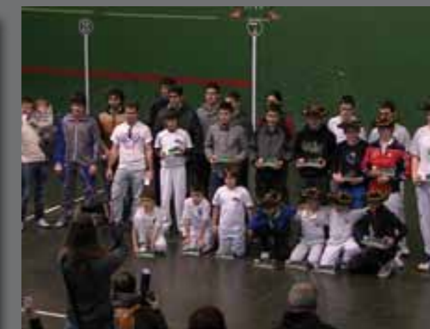
Abenduaren 15ean, pilota partidaren ostean, omenaldia jaso zuen hainbat kirolarik