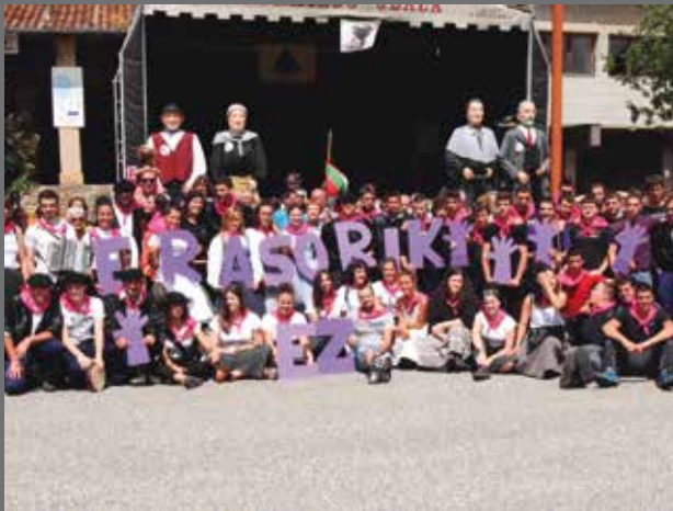
Indarkeria matxistaren aurkako mezu ozenarekin hasi ziren bi jaia.

2018ko jaiek egin dute berea herrigunean bezala Elbarrenan. Momentu on ugari utzi dizkigute bi festa batzordeek egiten duten lanari esker. Datorren urtean gehiago!