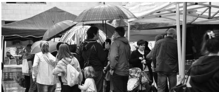
Aurreko urtean euria izan zen protagonista.

Urriaren 14an egingo da herrigunean Zizurkilgo Azoka Berezia. Ohi bezala, doako garraio zerbitzua izango da Elbarrenatik igotzeko.