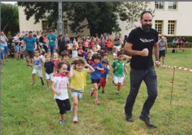
Txikienek majo gozatu zuten jaietako azken egunean.