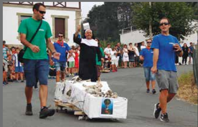
Goitibehera jaitziera berreskuratu da aurten, ezusteko gonbidatu eta guzti.