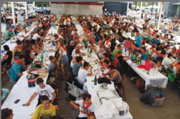
Ohi bezala, ehunka lagun elkartu zen festetako larunbateko herri bazkarian.