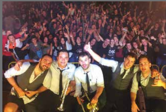
En Tol Sarmiento taldearen kontzertuak arrakasta handia izan zuen.