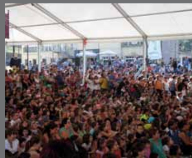
Pirritx, Porrotx eta Marimotots pailazoekin plaza bete haur eta guraso.