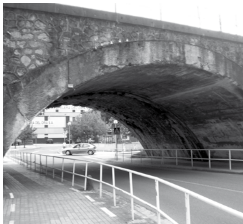
Tren zubia egokitu eta txukunduko da.

Azken alean aurreratu genuen bezala, Pedro Mari Otaño Plazan oinezkoei lehentasuna eman eta autoak plazatik kentzeko lanak egingo ditu Udalak. Obra honek hartzen du Aldundiak emandako diru laguntzaren zatirik handiena: 50.000 euro inguru (iaz egin zen aparkalekua barne hartuta). "Gure asmoa, zimiterioaren eta zuhaitzaren inguruan lur berria botatu eta banku batzuekin ingurua oinezkoentzako erreserbatzea zen. Proiektu hau ordea geldirik daukagu momentuz" dio alkateak. "Izan ere, plazako zuhaitzari kata bat egin behar