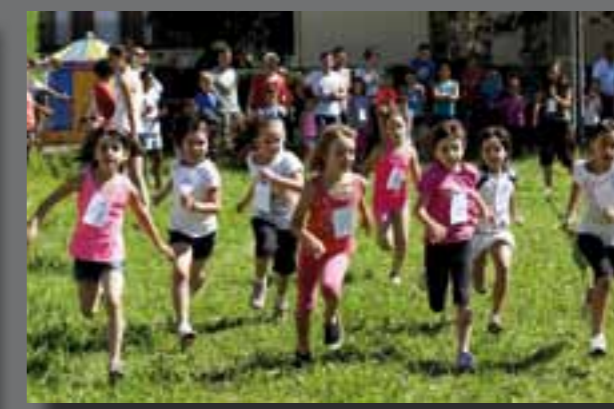
Umek lasterka egiteko abilezia erakutsi zuten.