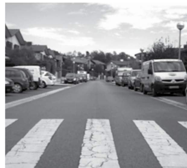
Abiadura moteltzeko gailuak jarriko dira.

konponketak. "Egoera txarrean dago. Itukin ugari daude, eta euria egiten duenean putzu handiak sortzen dira. Gainera ez dauka argiztapen egokirik",