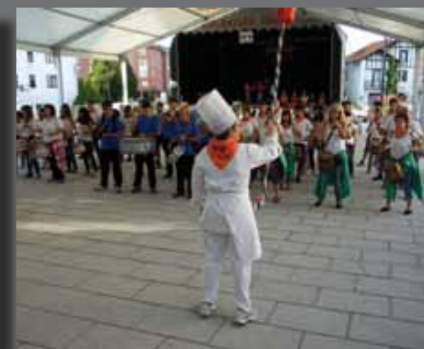
Elbarrenan, tanbor soinuekin egin zuten irailaren 4 arratsaldean festarako deia.