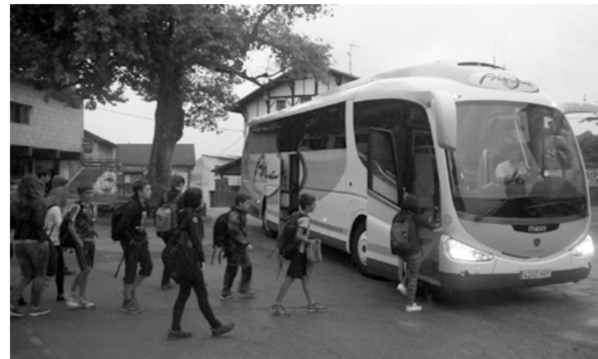
Zizurkilgo hainbat haur eskola garraio gabe gelditzeko arriskuan daude.

bizitzarekin kontziliatzen. Nik nire semea ez dut aurrez azaldu dugun egoeran oinez bidaliko, bost kilotik gorako motxila bizkarrean hartuta, egunero