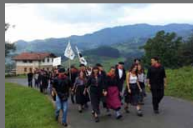
Lehen egunean, herriko gazteek festa giroa baserriz baserri zabaldu zuten oilasko biltzearekin.

Goiko eta beheko festetako zenbait une bildu ditugu irudietan