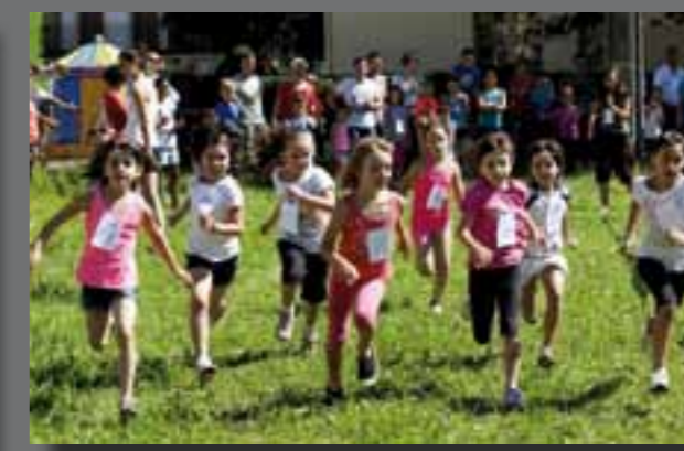
Umeez lasterka egiteko abilezia erakutsi zuten.