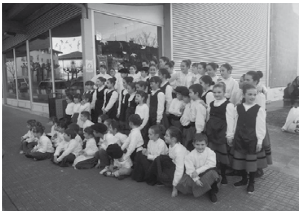
Bukalai taldeko gaztetxoak dantzaldi baten ostean.

Izan ere, dantza taldeak ondorio positiboak dauzka, herriaren kohesioari eta haurren arteko harremanei dagokionez: "Gure herrian hiru eskola daude. Bateko zein besteko umeez urrutiko harremana zuten, eta ekimen honek eu-