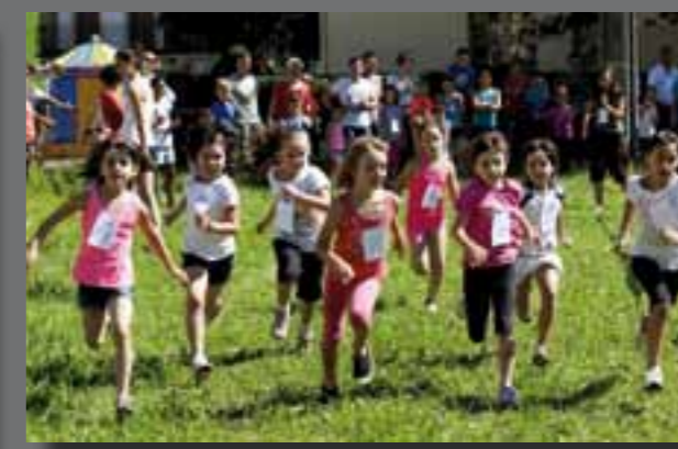
Umek lasterka egiteko abilezia erakutsi zuten.