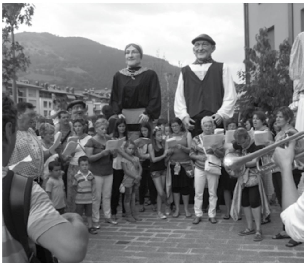
Kantu-jirako kideekin ibili ziren erraldoiak kalejiran.

Zizurkil Goiko festetan ere plaza bete jende ikusi genuen Vendetta taldearen kontzertuan. Horretaz gain, jendetza bildu zen hain ohikoak diren herritarren arteko herri kirol saioan, idi-probetan, edota azken urteetan sona hartu duen mozorro gauerako herriko zenbait gaztek prestatzen duten antzerkian. Aurten gainera sari potoloa jaso zuten irabazte suertatu ziren ijito kuadrilak eta kleopatrak, bakoitzarentzako afari eder bat.