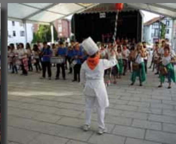
Elbarrenan, tanbor soinuekin egin zuten irailaren 4 arratsaldean festarako deia.