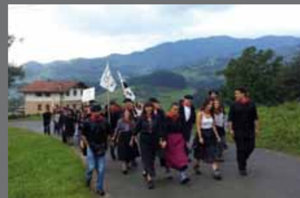
Lehen egunean, herriko gazteek festa giroa baserriz baserri zabaldu zuten oilasko biltzearekin.

Goiko eta beheko festetako zenbait une bildu ditugu irudietan