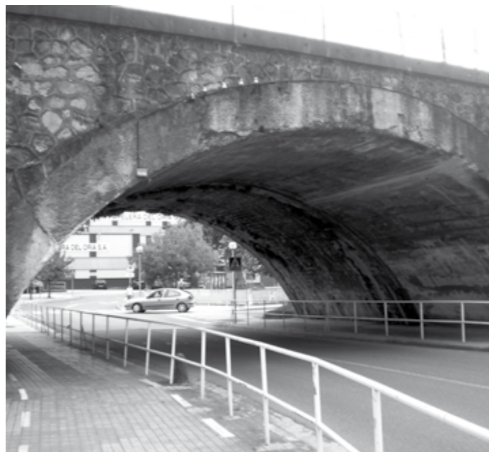
Tren zubia egokitu eta txukunduko da.

Azken alean aurreratu genuen bezala, Pedro Mari Otaño Plazan oinezkoei lehentasuna eman eta autoak plazatik kentzeko lanak egingo ditu Udalak. Obra honek hartzen du Aldundiak emandako diru laguntzaren zatirik handiena: 50.000 euro inguru (iaz egin zen aparkalekua barne hartuta). "Gure asmoa, zimiterioaren eta zuhaitzaren inguruan lur berria bota eta banku batzuekin ingurua oinezkoentzako erreserbatzea zen. Proiektu hau ordea geldirik daukagu momentuz" dio alkateak. "Izan ere, plazako zuhaitzari kata bat egin behar