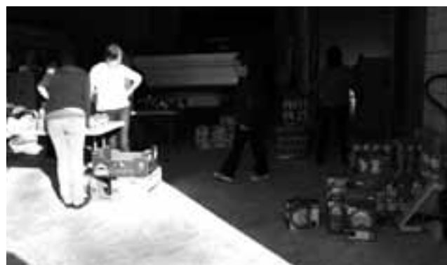
Herritar bolondresak elikagai bankuan lanean.

Dena oso zehaztua dagoela azpimarratu nahi izan du alkateordeak: “Familiako haur kopurua, familiaro kide-kopurua... Honen arabera elikagai sorta handiagoa edo txikiagoa