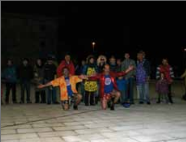
Antzerki Astearen baitan kale antzerkia egin zen.

Ekitaldi ugari ospatu dira azken asteetan. Argazki hauetan jaso ditugu horietako batzuk.