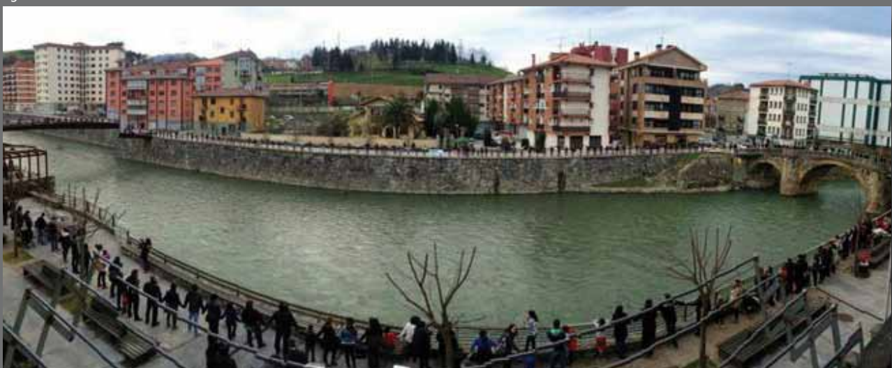
Gure Esku Dago ekimena Villabona eta Zizurkilgo zubiak alderik alde lotzea lortu zuen.