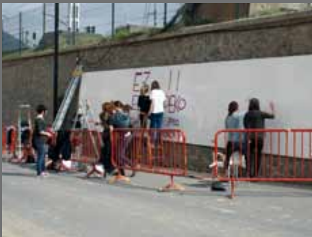
Herriko gazteek murala pintatu zuten emakumearen nazioarteko egunaren harira