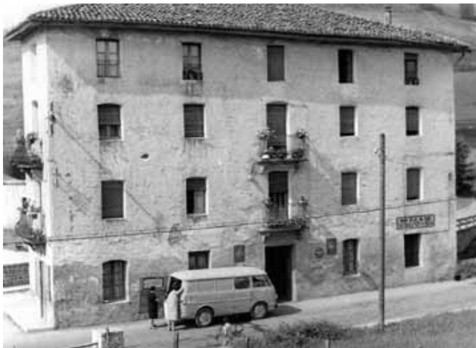
Teodosioenea 60ko hamarkadan.