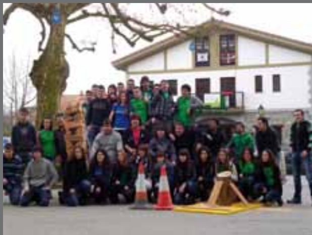
Gazte egunean neska-mutilek herri kiroletan hartu zuten parte.