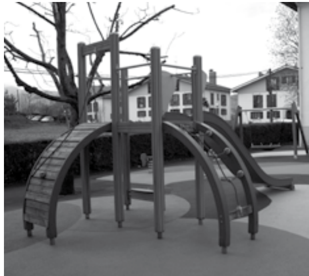
Zizurkil goiko haurrek jolas lekua dute berriro.

rra egokitu zaigu, baina horri esker, Udala orain askoz bideragarriagoa da duela 3 urte baino. Bide honetatik jarraituz, etorkizun hurbilean proiektu handiagoei ekiteko aukera izango da". 2014ko aurrekontua datozen egunetan egingo den Udalbatzan onartuko da.